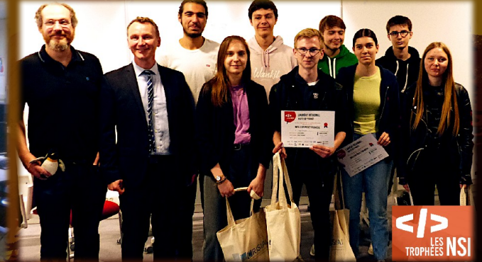
Trophées NSI : lauréat régional