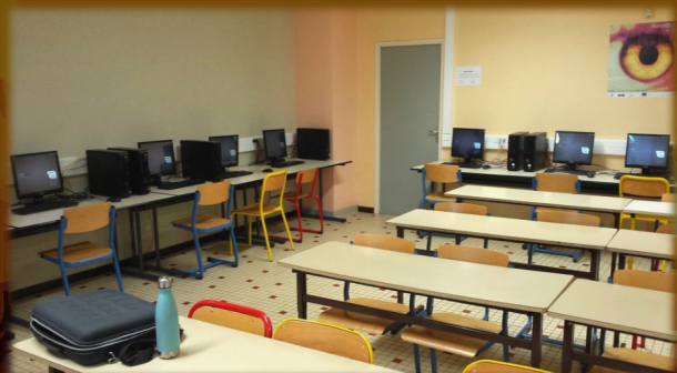
GNU/Linux au Collège