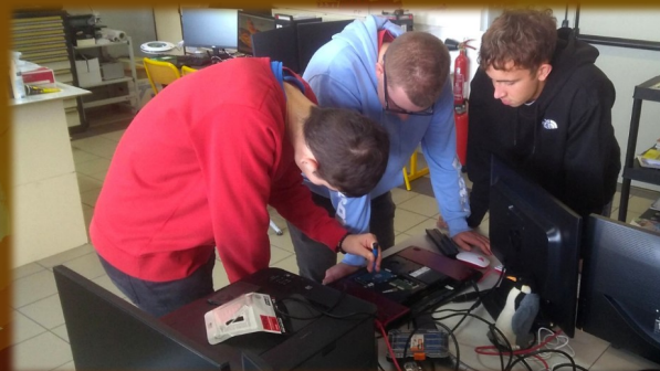
20 Primitux-Ecole primaire