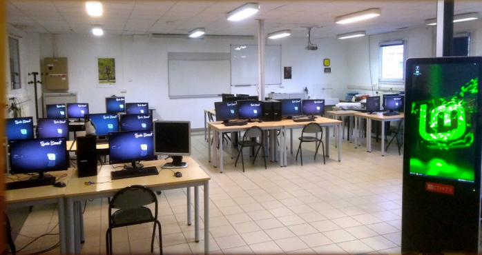
Intégration au réseau pédagogique