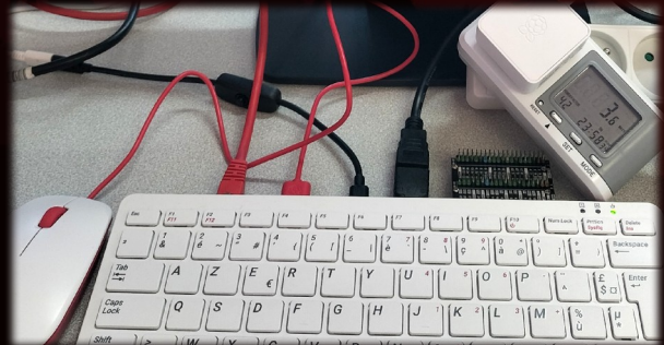
Consommation < 4 wh