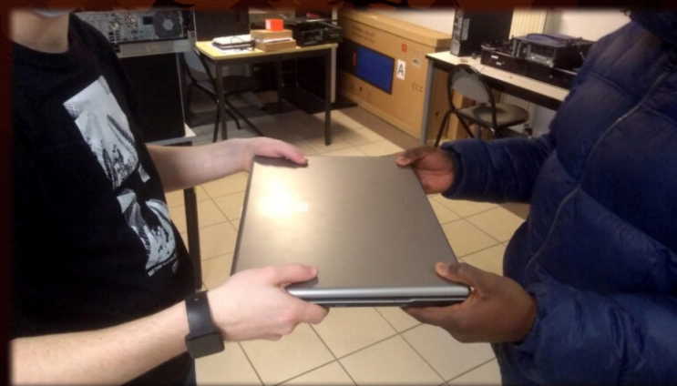
Equiper les élèves sans matériel