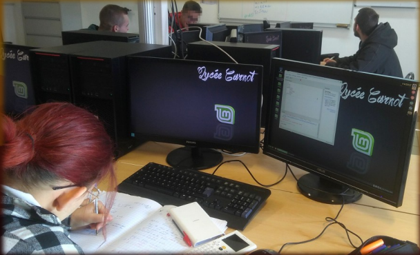
Pour toutes les sections